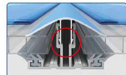
Afb. 10 mm-platen